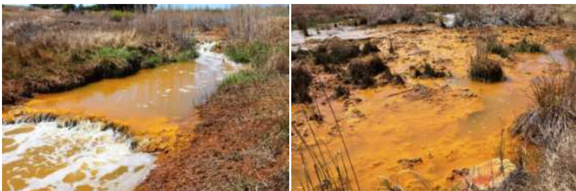
Tweelopiespruit wat vloei deur die Krugersdorp Wildtuin

Suurmyn water vloei sedert 2002 uit die oorstroomde Westelike mynkom in die Wes Rand. Dit het vernietigende effekte op ekosisteme, rivierstelsels, grondwater, akwatiese biota en reseptor damme. Byvoorbeeld: Die Tweelopiespruit, 'n ontvangende spruit van suurmyn water is vandag 'n Klas V Rivier, d.w.s. 'n hoogs akute toksiese rivier; die Robinsonmeer se uraanvlakke is 16mg/l (2002), d.w.s. 40 000 hoer as die uraan vlakke in natuurlike vars water; 800 kg uraan bereik die Boskop Dam, die hoof drinkwater reservoir van Potchefstroom jaarliks; ens.