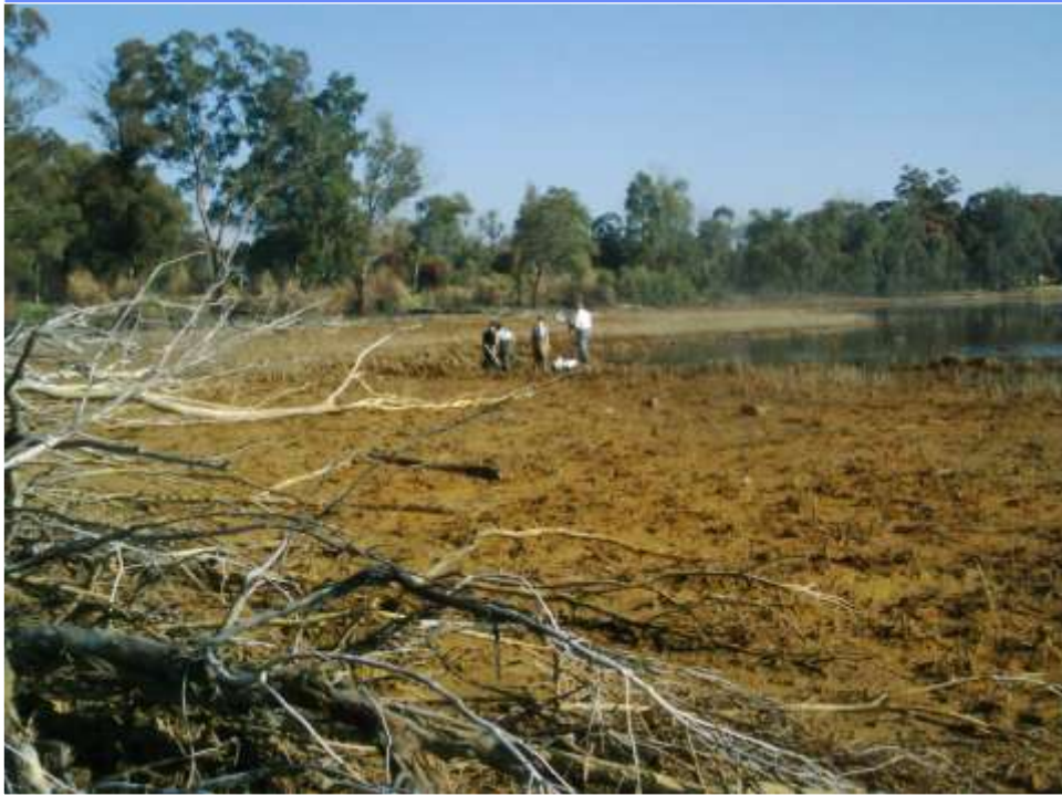
Robinsonmeer met 'n pH van 2 en uraan vlakke van 16mg/l (2002)

Chroniese blootstelling aan suurmyn water kan lei tot trans-geslagtelike of genetiese impakte, kankers, velletsels, verswakking van waarnemings-funksies en die neurale ontwikkeling van die fetus kan be-invloed word watkan lei tot verstandelike vertraging.